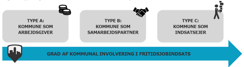
Figur: Typologi over kommunale roller i fritidsjobindsatser

I type A er kommunen udelukkende involveret som arbejdsgiver og varetager ikke en rolle i selve driften eller udførelsen af fritidsjobindsatsen. I type B er kommunen en aktiv samarbejdspartner i gennemførelsen af fritidsjobindsatsen. I type C er fritidsjobindsatsen forankret hos kommunen, som dermed er indsatssejer.